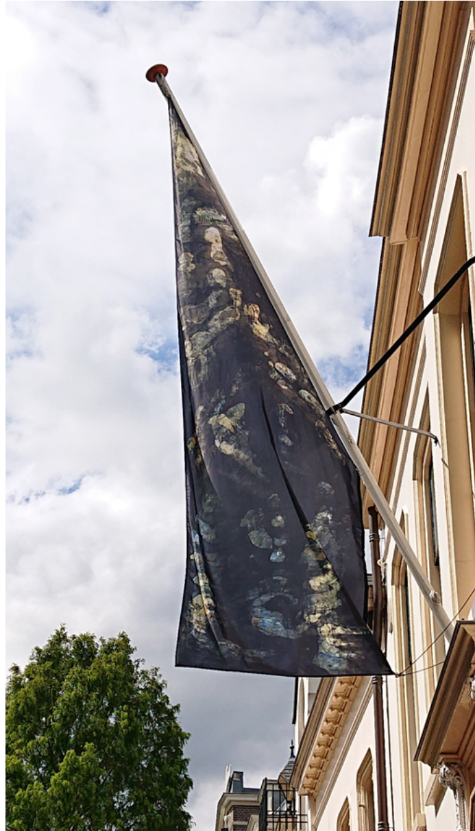
Jardin à la Française, ontwerp en vlag, 425 x 135 x 144,5 cm, K.F. Hein Fonds, Utrecht, 2020